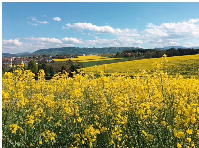
... zerstört das Naturparadies im Grüngürtel der Stadt!

Sprechen Sie sich gegen den Bau einer Westspange aus, helfen Sie den Lebensraum „Steyrer Grüngürtel“ zu erhalten und unterschreiben Sie jetzt, bevor es zu spät ist.